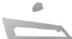
Acabado: Nickel Serie: DM, DN, DP Paso: 1 foro, 96, 160