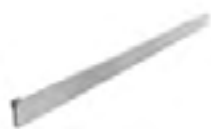
Acabado: Inox Serie: C2,C3,C4,C5 Paso: 28,128,192,480