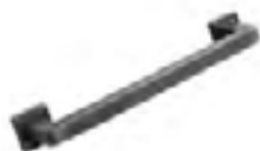
Acabado: Peltro Serie: G1 Paso: 128