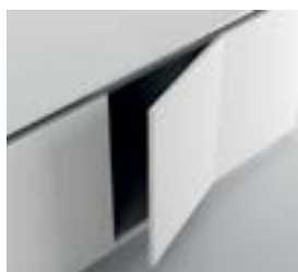
GOLA A L / C