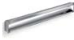
Finishes: Aluminio Series: JU, JL, JN(horiz.), JO(vert.) Pitch: 96, 160, 1480, 480