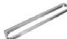
Acabado: Nickel Serie: M1 Paso: 160