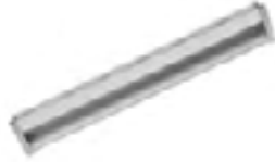
Acabado: Aluminio Serie: KC