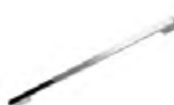
Acabado: Cromo Serie: AA,AB,AC,AD Paso: 32,128,192,480