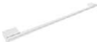
Acabado: Blanco Serie: D1,D2,D3,D4,D5,D6,D7 Paso: 96,160,192,480,768,1056,1216