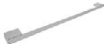
Acabado: Nickel, Serie: H1,H2,H3H4,H5,H6,H7 Paso: 96,160,192,480,768,1056,1216