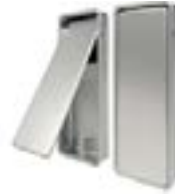
Acabado: Aluminio, Brown, Bianco Serie: S4, S5, S6