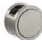
Acabado: Nickel,Blanco/Nickel,Blanco Serie: B8,B9,B0 Paso: 96,192